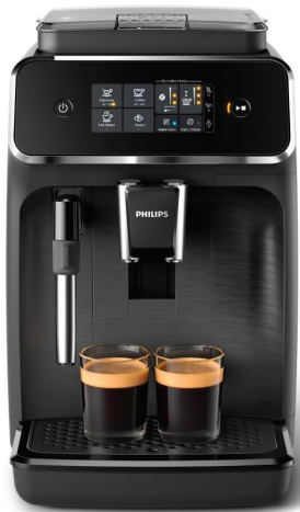
Machine Expresso Philips 2200

VISITEZ TOUS LES EXPOSANTS ET VOUS POURRIEZ VOUS MÉRITER