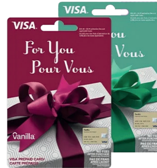
l'une des 2 cartes-cadeaux de 150$